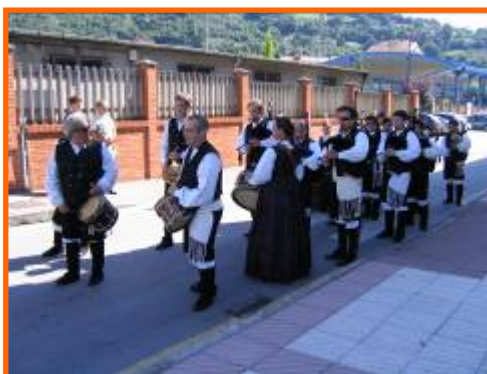
IX Encontro de Bandas de Gaitas. Riaño-Langreo

- 07/09/2008: IX Encontro de Bandas de Gaitas. Riaño-Langreo.