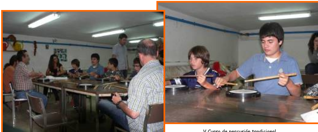
V Curso de percusión tradicional

Xa clásico, o curso de percusión tradicional que organiza Queiroa tódolos anos, supón ademais dunha base para tódolos alumnos e alumnas, unha aposta polo coñecemento e especialización na esquecida percusión tradicional galega.