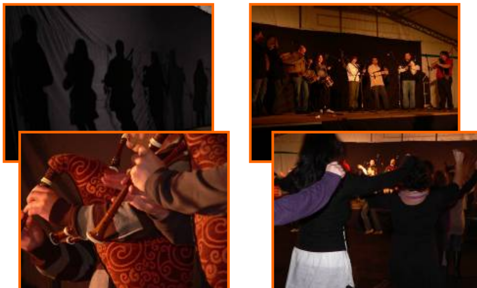
I Foliada de Sada

Éxito de organización, público e participantes.