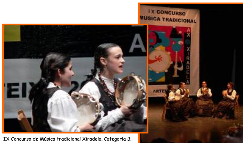
IX Concurso de Música tradicional Xiradela. Categoría B.