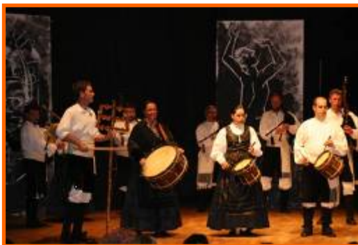
Festival "Queiroa, lévame, lévame"

- 16/08/2008: Pasarrúas-Alborada de Sada.